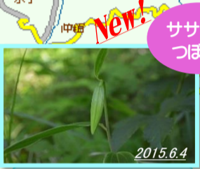
New! ササユリ つぼみ

※関門-土小屋(約18km・30分) ※7:00-20:00 通行可(6/1~6/30)