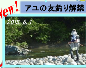
New! アユの友釣り解禁!