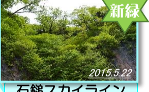
石鎚スカイライン

※関門-土小屋(約18km・30分) ※7:00-20:00 通行可(6/1~6/30)