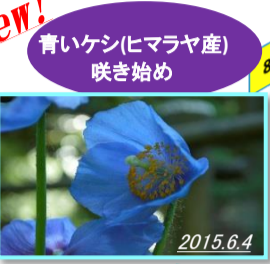
New! 青いケン(ヒマラヤ産) 咲き始め