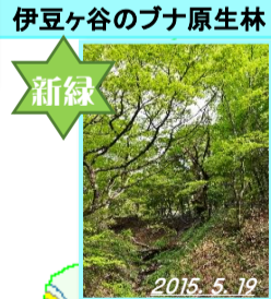
伊豆ヶ谷のブナ原生林