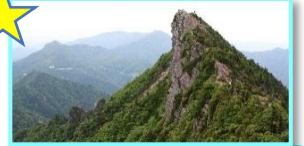
西日本最高峰 石鎚山 ※7/1~7/10 お山開き

面河溪からおよそ7.5kmで石鎚山頂へ 四季の渓谷美と石鎚山の山容の変化をお楽しみください！