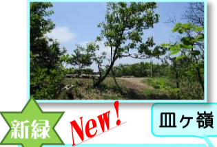
新緑 New! 皿ヶ嶺