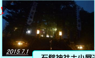
New! 石鏡神社土小屋選擇殿 2015.7.1

ご案内の内容は記入日現在の見どころを紹介したものです。 ぜひ、グループ、ご家族連れでお出かけください。なお、自然の様子は 環境や天候に大きく影響を受けるため、内容の状況が変わることもあり ますので、あらかじめご了解ください。