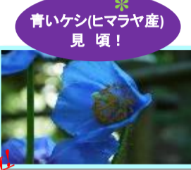
New! 青いケシ(ヒマラヤ産) 見頃！ 2015.7.3 愛媛新聞で紹介されました！