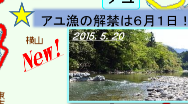
アユ漁の解禁は6月1日!