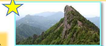
西日本最高峰 石鎚山

面河溪からおよそ7.5kmで弥山へ四季の溪谷美と石鎚山の山容の変化をお楽しみください！