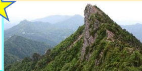
西日本最高峰 石鎚山