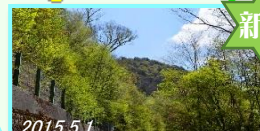
石鎚スカイライン